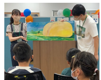
4年度 ワクワクおはなし会の様子